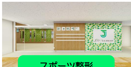
スポーツ整形 リハビリテーション