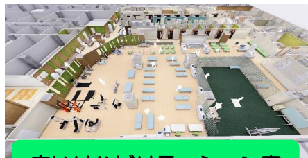
広いリハビリテーション室